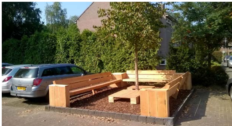
BANKJE ZWALUWSTRAAT resultaat van ondersteund buurtinitiatief