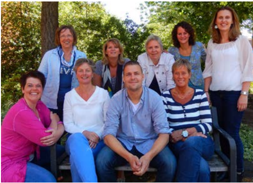
Het Sociaal Team